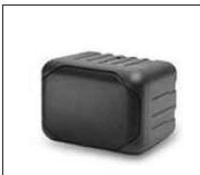
(5) スピーカー型盗撮器