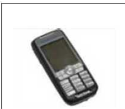
(8) 携帯電話型室内盗聴器