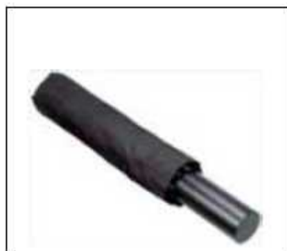
(9) 折畳み傘型室内盗聴器