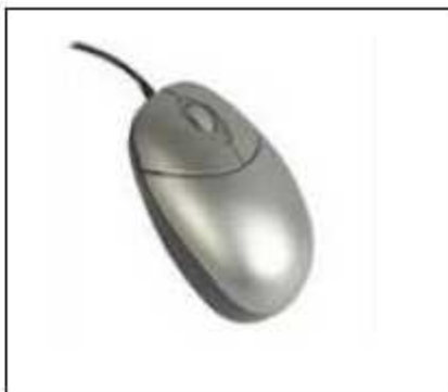
(2) マウス型室内盗聴器