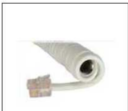
(4) カールコード型電話盗聴器