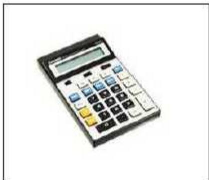
(1) 電卓型室内盗聴器・盗撮器