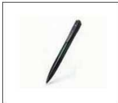
(3) ペン型室内盗聴器・盗撮器