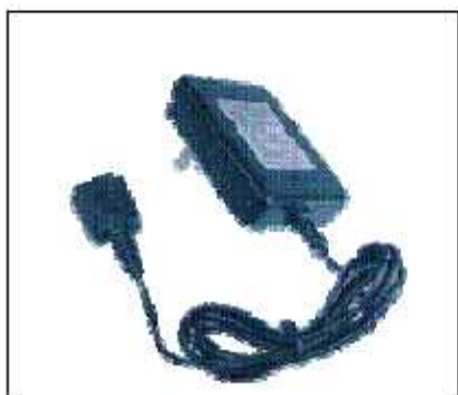
(7) 充電器型室内盗聴器